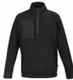
SWEAT DEMI-ZIP SANDSTONE