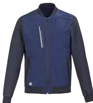
BOMBERS MIXTE ROWEL