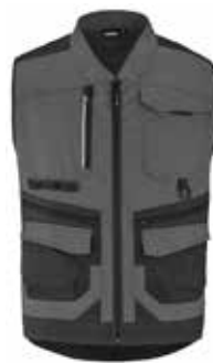
GILET HOMME TROWEL