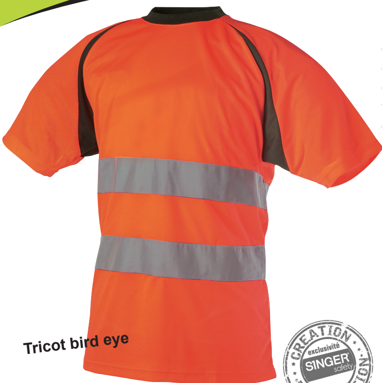
Tricot bird eye